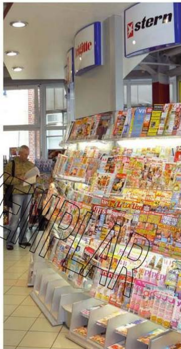
Freie Auswahl: Ein vielfältiges Pressesortiment ist Grundlage des Verkaufserfolgs; Große Pressehändler haben mehrere Tausend Titel im Sortiment.

Die gebietsbezogene Alleinauslieferung, das Remissionsrecht , die Disposition und die Preisbindung stellen in der wechselseitigen Beziehung die Voraussetzungen für einen effektiven, bedarfsgerechten und neutralen Vertrieb eines attraktiven Pressesortiments dar. Diese Besonderheiten bieten allen Presseverkäufern gleich gute Verkaufschancen!