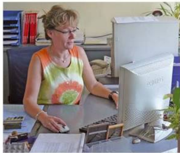
Mithilfe des VMP-Verfahrens behält Ihr Grossist die Liefer- und Verkaufsmengen im Blick und kann bei Ausverkäufen automatisch nachliefern.

Im Rahmen dieses Verfahrens werden Ihrem Grossisten am Ende eines jeden Verkaufstages online die Daten aller Presseverkäufe übertragen. Da er die Liefermengen und Abverkaufsgeschwindigkeiten kennt, ist er in der Lage, den aktuellen Lagerbestand und Bedarf zu ermitteln und gegebenenfalls „unaufgefordert“ nachzuliefern. Somit können Ausverkäufe minimiert und mehr Verkäufe realisiert werden. Stellt er fest, dass Sie von einem Titel über mehrere Tage kein Exemplar ver-