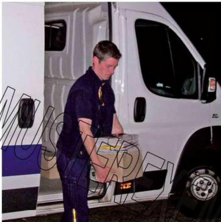
Nachtaktiv: Damit Zeitungen und Zeitschriften pünktlich zum Geschäftsbeginn bei Ihnen sind, arbeiten die Mitarbeiter Ihres Grossisten auch in der Nacht.

Gegen Verlust von Presse im Rahmen der Anlieferung gibt es Versicherungen.