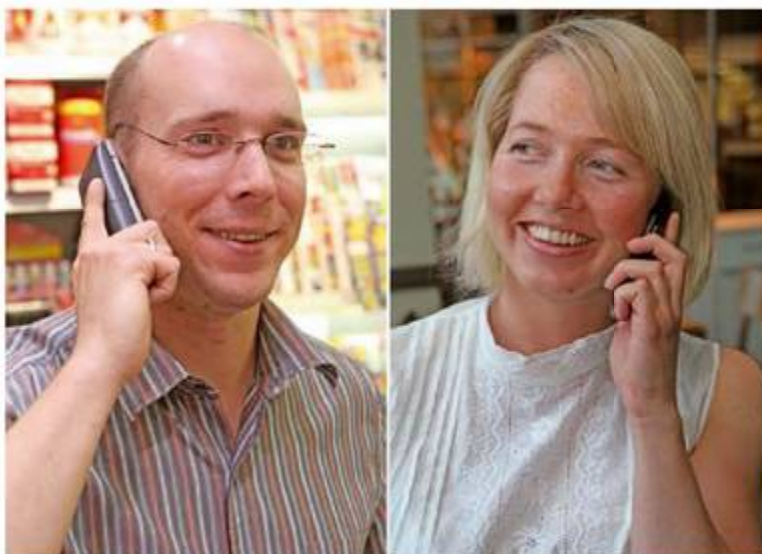
Die Kundendienstmitarbeiter Ihres Grossisten im Innendienst sind täglich von früh bis spät ansprechbereit und freuen sich darauf, Sie zu informieren und zu beraten.

Informieren Sie auch Mitarbeiter und Kollegen über aktuelle Informationen Ihres Grossisten!