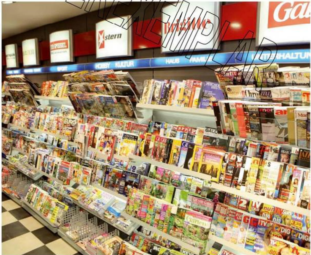
Bunte Vielfalt: Hier macht der Pressekauf Spaß. Moderne, mehrstufige Regale laden zum Verweilen und Stöbern ein. Eine klare Struktur hilft den Kunden, ihren Wunschtitel zu finden.

Sowohl für das gezielte als auch das spontane Kaufverhalten Ihrer Kunden hat sich eine Warenpräsentation mit einem strukturierten Sortimentsaufbau bewährt. Durch ein Belegungsschema bieten Sie Ihren Zielkäufern mehr Orientierung und Ihren Impulskäufern mehr Vielfalt am Regal.