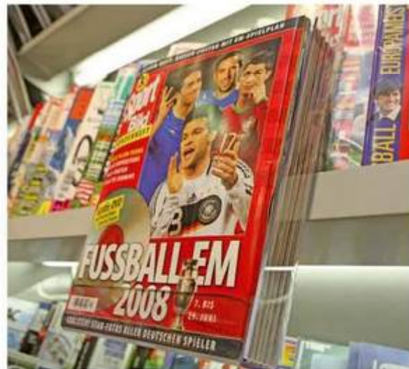
Nicht zu übersehen: Dank einer Regalschale steht dieser Titel in erster Reihe.

Was an hervorgehobener Stelle präsentiert und angeboten wird, wird auch gekauft!