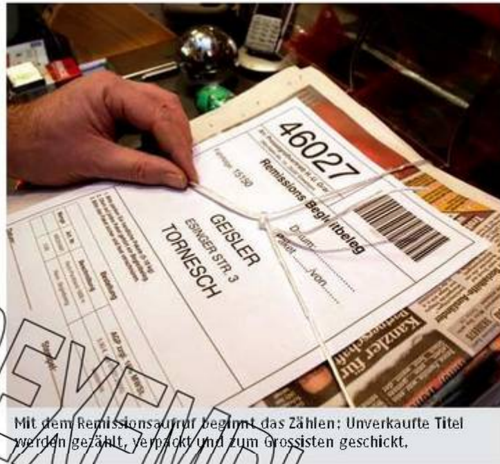
Mit dem Remissionsaufruf beginnt das Zählen; Unverkaufte Titel werden gezählt, verpackt und zum Grossisten geschickt.

Für jeden Titel, den Ihr Grossist Ihnen liefert, ist eine bestimmte Angebotszeit vorgesehen. Entscheidend für die Remissionsrückgabe ist der Remissionsaufruf. Er erfolgt durch individuell für Ihren Betrieb erstellte Remissionsscheine. Sie finden darauf die zur Remission aufgerufenen Titel und Folgen für den Tag, an dem die Remissionsendung bei Ihnen abgeholt wird.