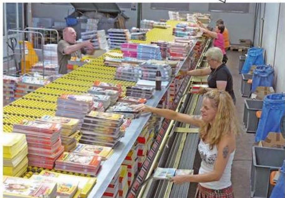
Kommissionierung beim Grossisten: Hier werden individuelle Pakete für jeden Händler zusammengestellt. Die Liefermengen richten sich nach einer zuvor errechneten Verkaufsvorhersage.

Auch die Nachlieferung von Altausgaben sucht Ihr Grossist möglich. Da die Angebotszeit für diese Presseobjekte schon abgelaufen ist, geht das allerdings nur im Festbezug, d.h. ohne Remissionsrecht.