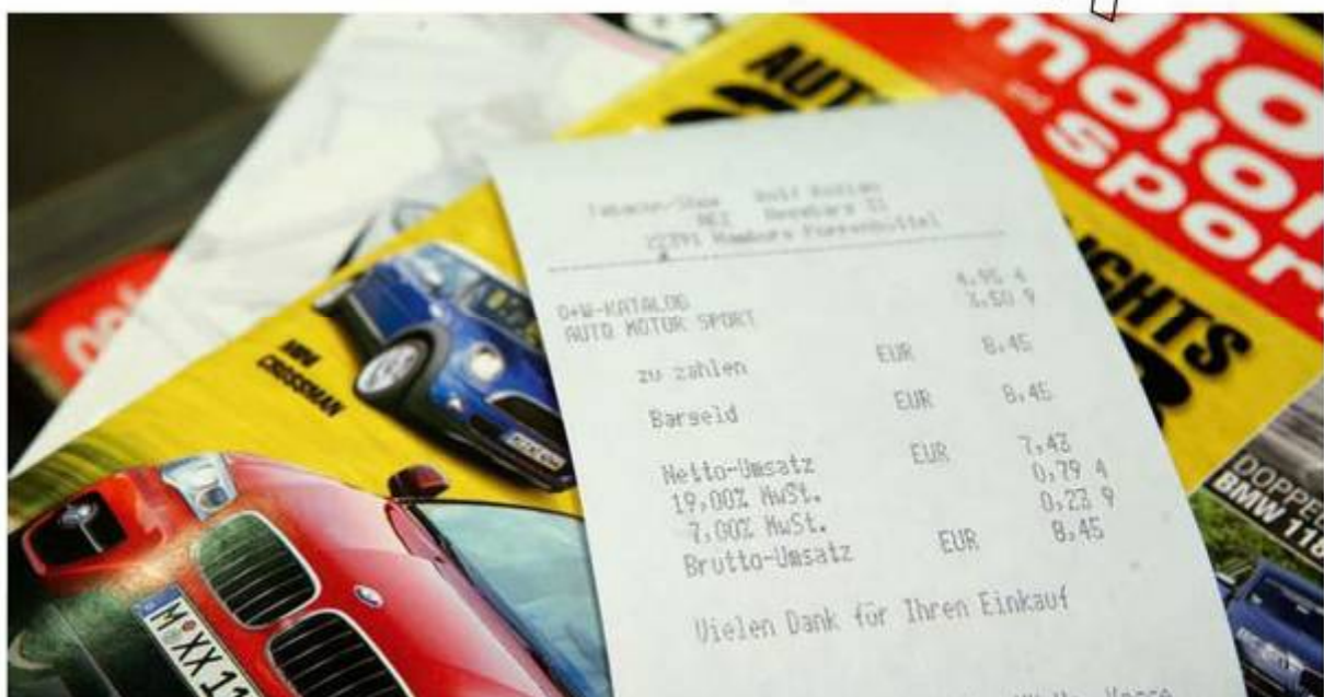
Während Offertenblätter, Kataloge, Sammelbilder und Kalender mit 19 Prozent besteuert werden, genießen Zeitungen und Zeitschriften den Vorteil eines ermäßigten Mehrwertsteuersatzes von sieben Prozent.

Vom Gesetzgeber gefördert genießen Presseerzeugnisse den Vorteil eines ermäßigten Steuersatzes. Offertenblätter, Kataloge, Sammelbilder, Kalender und andere „Nonpress“-Produkte unterliegen dagegen dem jeweils gültigen vollen Mehrwertsteuersatz. Für „vertriebsbeschränkte“ Druckschriften gilt ebenfalls der volle Steuersatz.